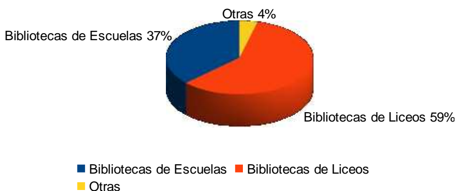
Bibliotecas elegidas examen final

Esta modalidad de evaluación final para aprobar el curso de Administración I, -en vez del examen final- fue incorporada desde el año 2008, por tanto los datos de las bibliotecas elegidas, se refieren a los últimos 4 años. Se realizaron en este período, 46 trabajos referidos a: 17 bibliotecas escolares ( 37 %) (9 de Montevideo y 8 del Interior), 27 bibliotecas liceales (59 %) (15 de Montevideo y 12 del Interior) y además, la biblioteca pedagógica de Montevideo y la biblioteca pública de Paysandú ( 4 %) (Anexo 2)